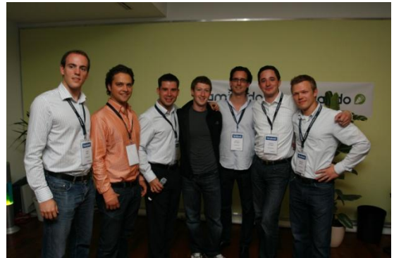
Facebook-Gründer Mark Zuckerberg besucht amiando im Münchner Büro